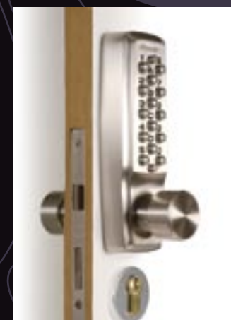
REF. 22103-JPM 50