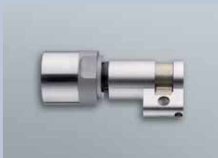
Demi-cylindre profil suisse 3061